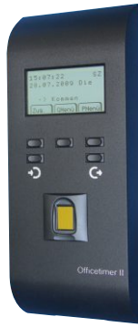
Officetimer II mit Fingerprint