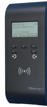
Officetimer II Basic und Standard